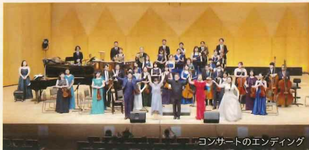
コンサートのエンディング

心に残る名作映画とミュージカル映画のメロディーをオーケストラサウンドでたっぷりとお楽しみいただきました。