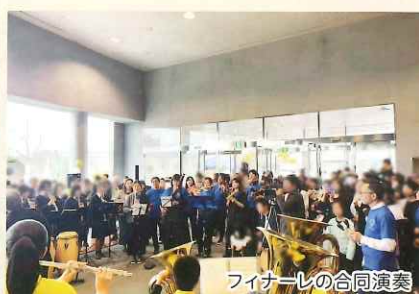
フィナーレの合同演奏