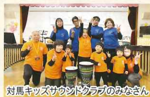
対馬キッズサウンドクラブのみなさん

「感謝の気持ちを音楽にのせて」と題して、対馬の子ども達とNOCEメンバーの共演で、2年間の支援成果を披露する素敵なコンサートになりました。