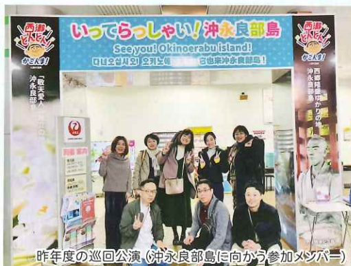
昨年度の巡回公演。(沖永良部島に向かう参加メンバー)