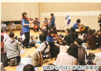
0歳からのはじめての音楽会