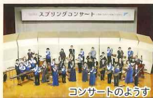
コンサートのようす