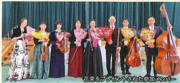
花束をプレゼントされた参加メンバー

NOCE8人編成のアンサンブルで、開校60周年を迎えた大村特別支援学校を訪問し、お祝いのコンサートを行いました。小・中学部の皆さんが音楽の授業で触れたクラシック作品を演奏し、校歌の共演もしました。