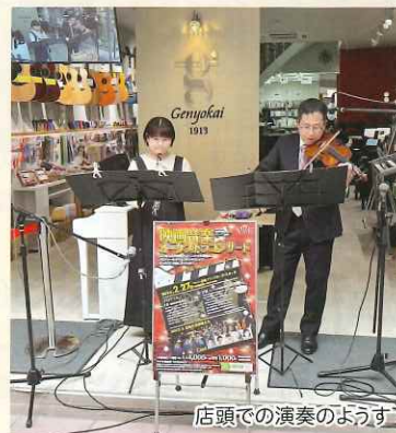
店頭での演奏のようす

今回は「映画音楽オーケストラコンサート」のPRをさせていただきました。ランタンフェスティバル皇帝パレード直前の浜町アーケードでは、たくさんのお客様が足を止めて聴いてくださいました。