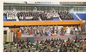
みんながピースなコンサート