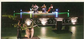
いけばな昔と今と...そして未来