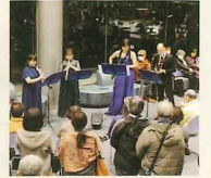
大村ロビーコンサート