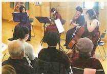
上長崎地区ふれあいセンター