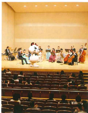
(写真は昨年の模様)

親子やファミリーでたっぷり音楽をお楽しみ下さい。幼児、赤ちゃん連れも大歓迎です!