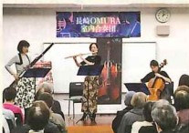
小ヶ倉地区ふれあいセンター