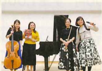
大村中地区公民館

長崎市浜町 絃洋会楽器店前でPRコンサート10月25日(土)・11月23日(日)祝