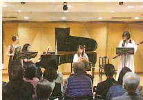
長崎大学・創楽堂