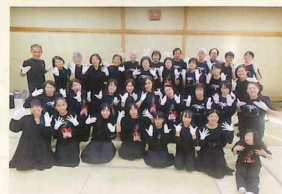
ホワイトハンドコーラス