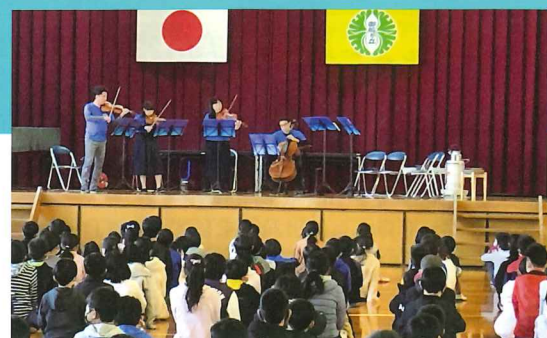
昨年のスクールコンサートのようす